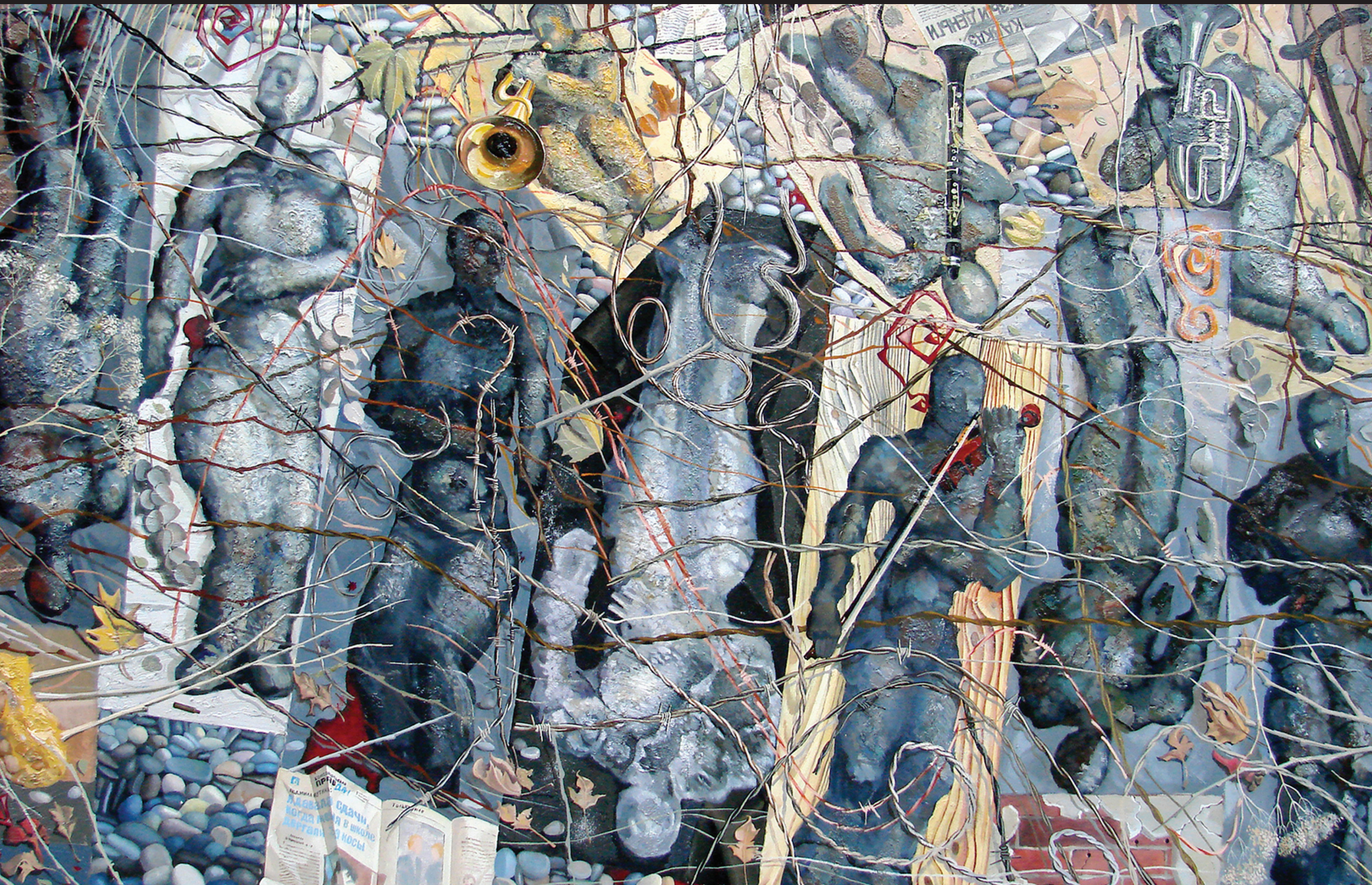
ნუგზარ მგალობლიშვილი „რეკლექციები“