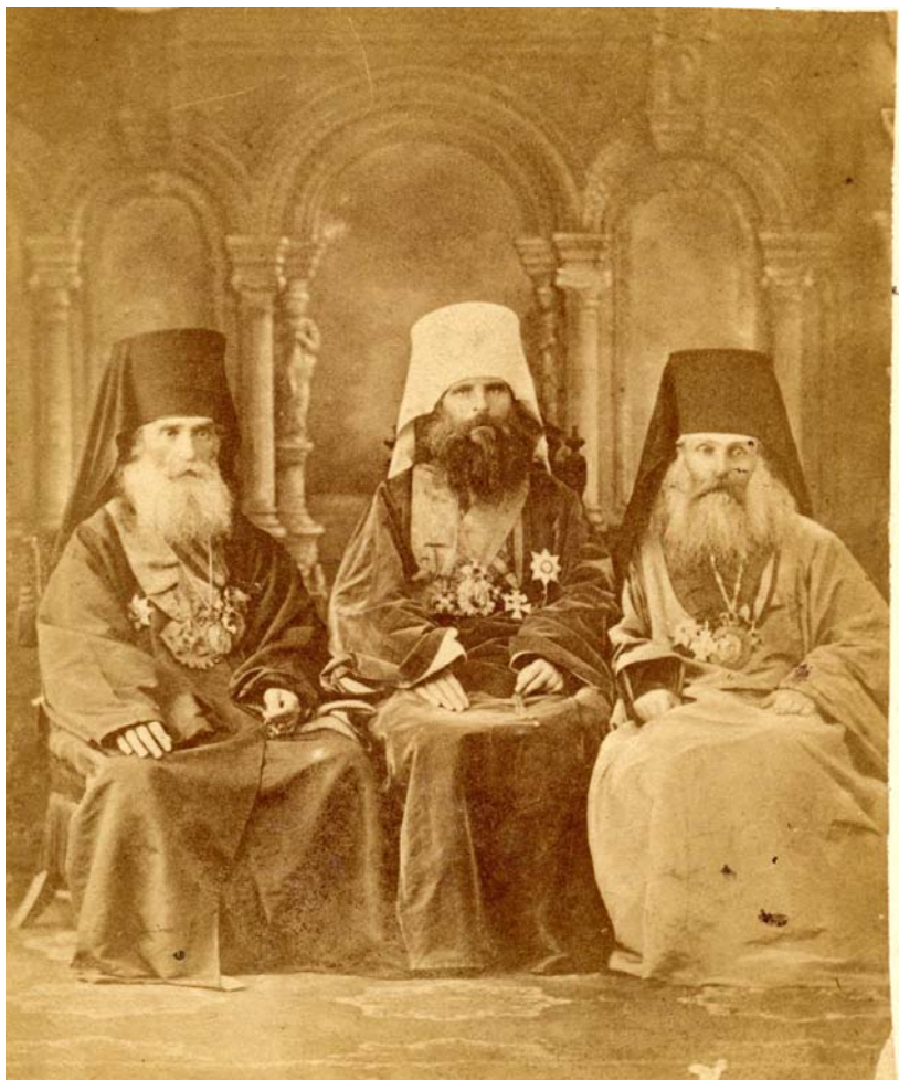
ეპისკოპოსი გაბრიელი (ქიქოძე), საქართველოს ეგზარქოსი იოანიკე (რუდნევი) და ეპისკოპოსი ალექსანდრე. 1882 წელი