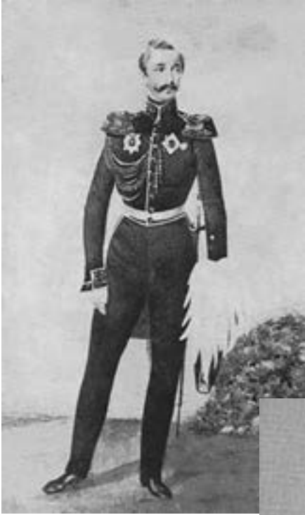
აფხაზეთის მთავარი მიხეილ შარვაშიძე