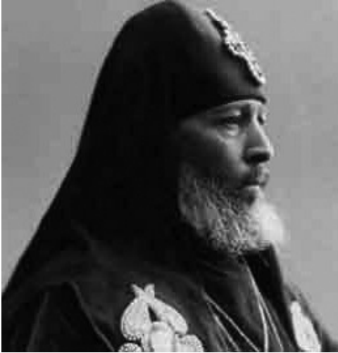
წმინდა მღვდელმონაპე კირიონ II (საძაგლიშვილი)