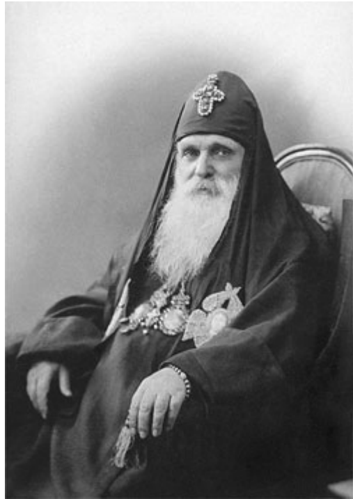
წმინდა აღმსარებელი ამბროსი (ხელაია)